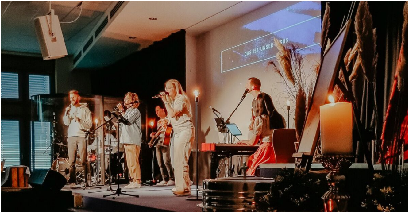
Gottesdienst der VivaKirche Mannheim