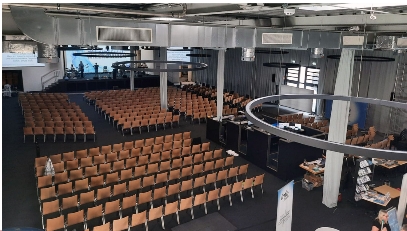
Blick in den neuen Veranstaltungsraum mit Platz für bis zu 800 Personen