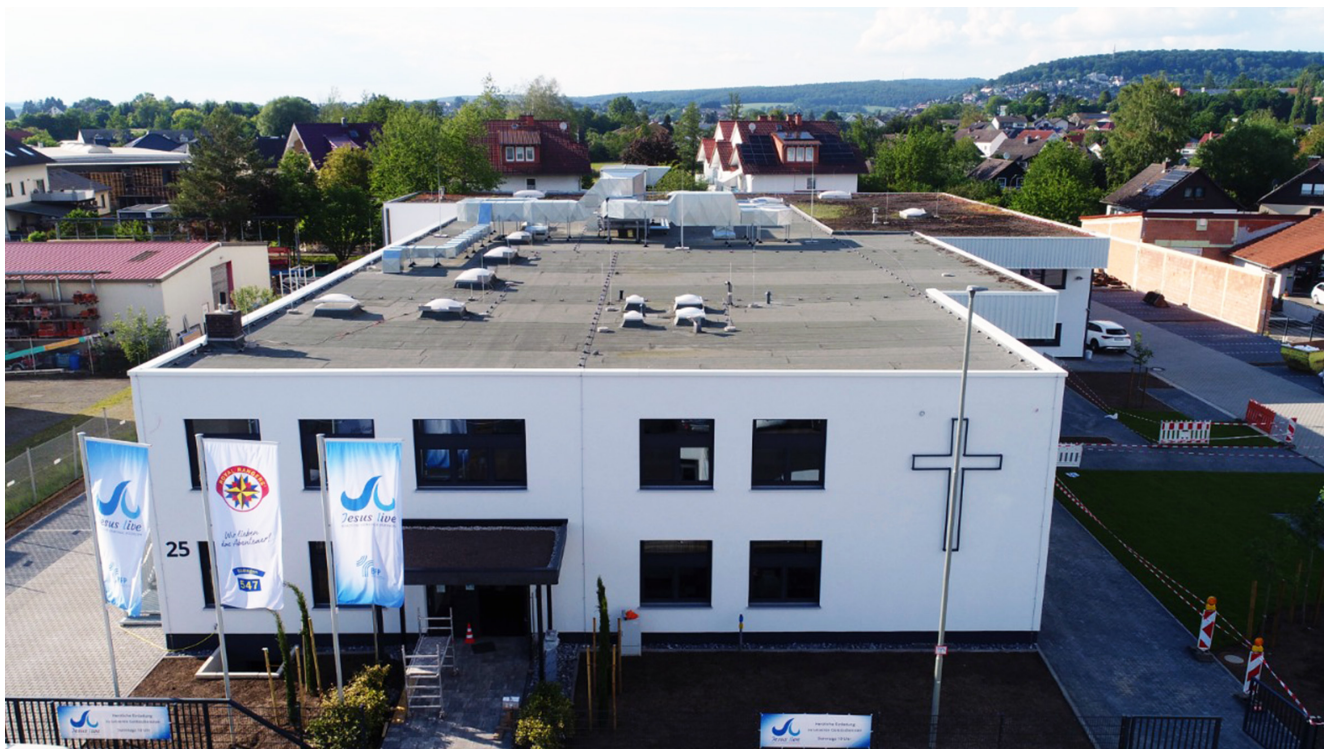
Das neue Gemeindezentrum in Büdingen