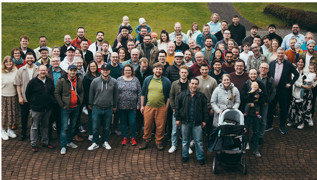
Teilnehmer der Neupastorentage 2023