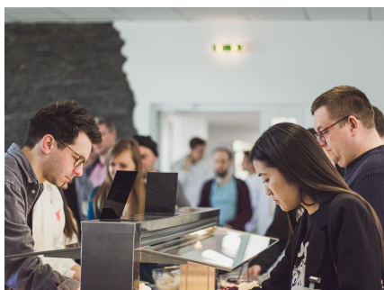
Impressionen von den Neupastorentage 2023